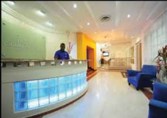
HODELPA CARIBE COLONIAL Santo Domingo