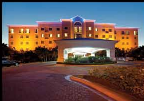
HODELPA GARDEN COURT Santiago