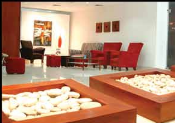
HODELPA CENTRO PLAZA Santiago