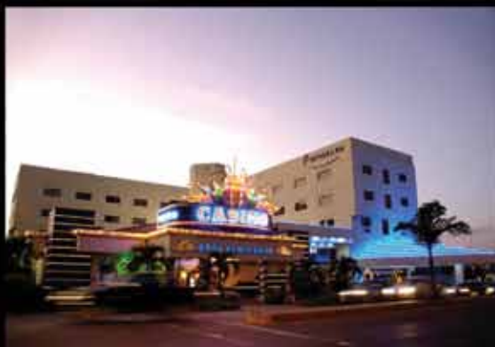
HODELPA GRAN ALMIRANTE Santiago